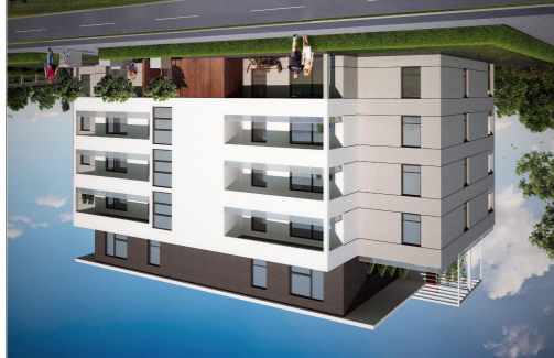
POŁOŻENIE MIESZKANIA W BUDYNKU